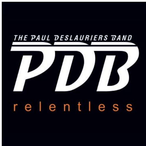
Titre: Relentless Date de sortie : 3 juin 2016 ACCES AUDIO